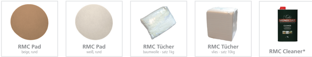
RMC Pad beige, rund